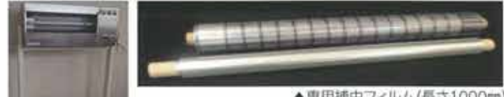
▲専用捕虫フィルム(長さ1000mm)