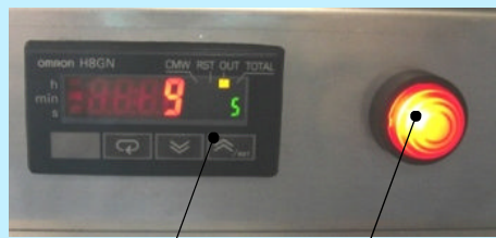
捕虫数表示ディスプレイ 警報ランプ