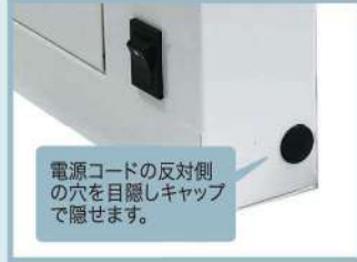
電源コードの反対側の穴を目隠しキャップで隠せます。