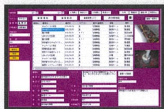
問題事案の一括管理。進捗管理、プライベートデータ化も可能